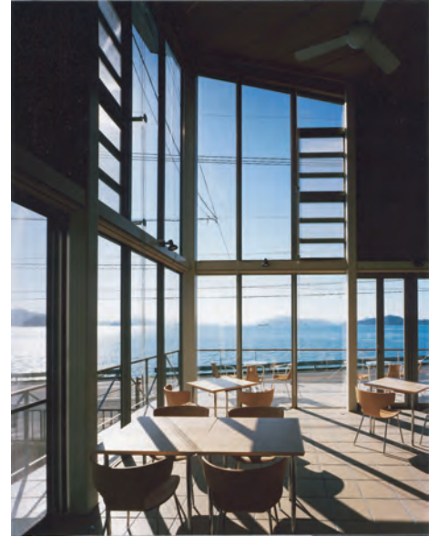
店内より瀬戸内の海を見る