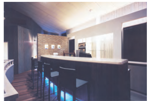
手前はバーカウンター 壁の裏がエントランス