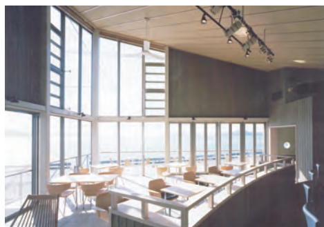
どの客席からもパノラマ的な景色が楽しめる