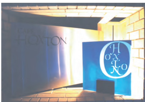
エントランスサイン