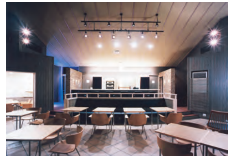
海側の客席よりバーカウンターを見る