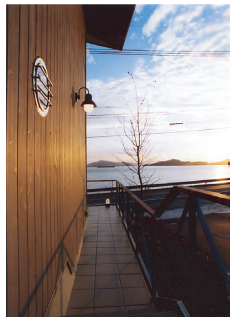
エントランスからの風景