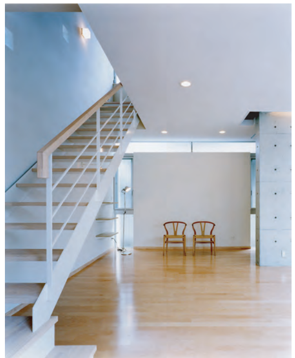
階段下にピアノが置かれ音楽を楽しむコーナーとなる