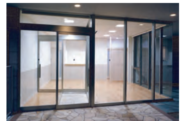
ポーチより待合室を見る