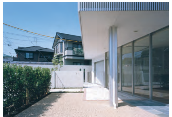
クリニック エントランス