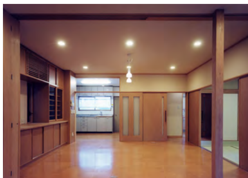
寝室より居間・食堂を見る