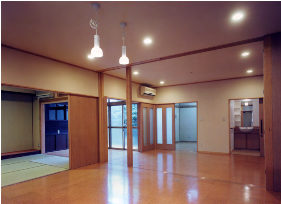
居間・食堂 引戸を開ければ全ての空間が一つにつながる