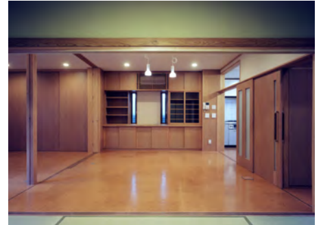
客間より居間・食堂を見る

築 50 年になる木造住宅の全面改修である。ご高齢になられたご主人と、介護をされる奥様の負担が少しでも軽減できる住まいを求められた。子育て期に増改築が繰り返されたことで、光や風が届かない部分や、至る所に段差が生じていた。内部の改修を行えば生活改善はできたが、築年数が経過していたので、耐震補強・断熱改修・白蟻対策を施し、安心安全な住まいへの改修を提案した。