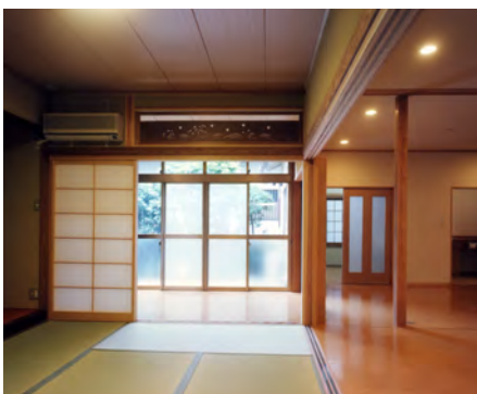
客間・サンルーム