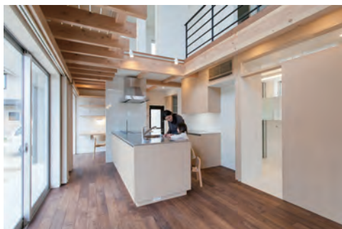
居間よりキッチンを見る