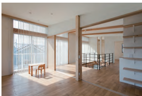
2階子ども室よりホール・吹抜・主寝室を見る