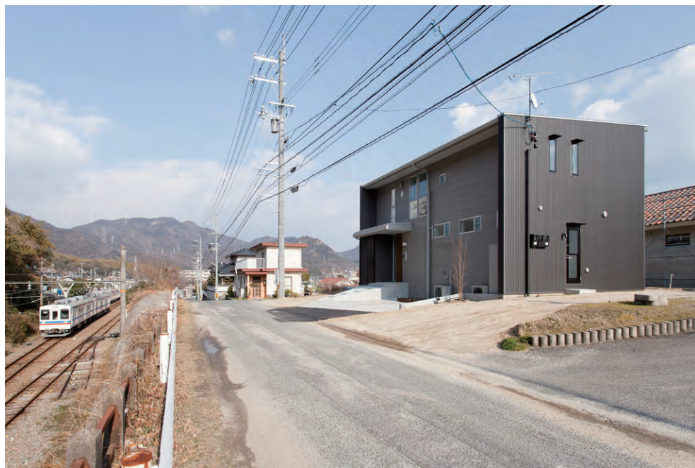
西側外観 左側には山が右側には草原が広がる