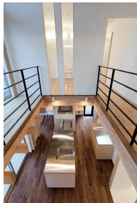
2F ホール吹抜けよりキッチンを見る