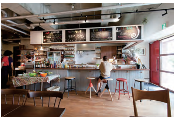
客席よりカウンターをみる