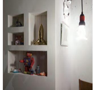
② 壁を利用した飾り棚