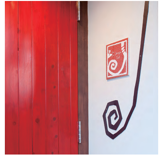
① オーナーデザインのサイン