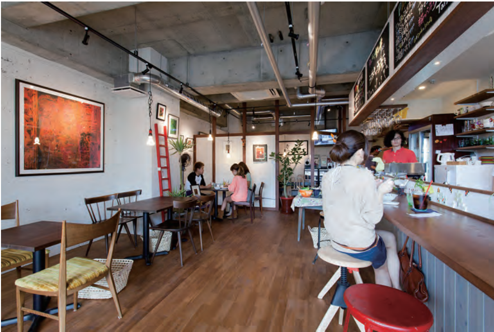
出入口側より店内を見る