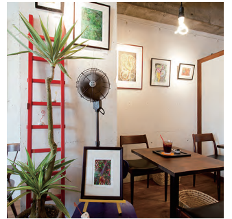
③ 壁はギャラリースペース

川沿いを散歩していて赤い扉を見つけると「今日は何があるのかなあ～ノゾイテミル?」。店内には1000枚のJAZZ CDからオーナーがセレクトした音楽が流れている。アートに目を奪われながら、8種類もあるこだわりのパンケーキを堪能する。時間を忘れゆったりと過ごしてもらえる場所として、お店がキャンパスになるように、空間は控えめに、内装は素材をそのまま表した。